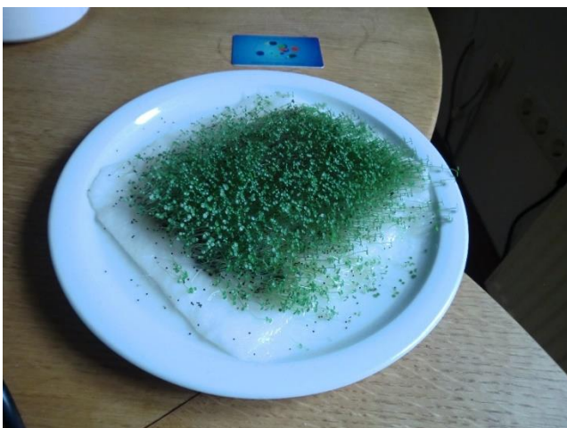
Bild: Standort des WLAN-Routers NETGEAR